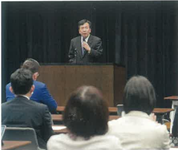
12月4日、両院議員総会にて挨拶を行なう立憲民主党 枝野幸男 代表

立憲民主党は、与党の数の力によって臨時国会が事実上の閉会となった12月4日、国会内で両院議員総会を開催しました。挨拶に立った枝野幸男代表は、立憲民主党をはじめとする野党がCOVID-19の感染拡大防止のために新型インフルエンザ特別措置法改正案等の多くの法案を提出しているにも関わらず、政府・与党が審議をせずに閉会することや、吉川元農水大臣の金銭授受疑惑、あるいは安倍前総理が1年にわたり虚偽答弁を続けていた疑いがあることを取り上げ、「本当に明らかにしなければならないこと、審議しなければならないことが多々ある中での閉会であることに強く抗議したい」と強調しました。